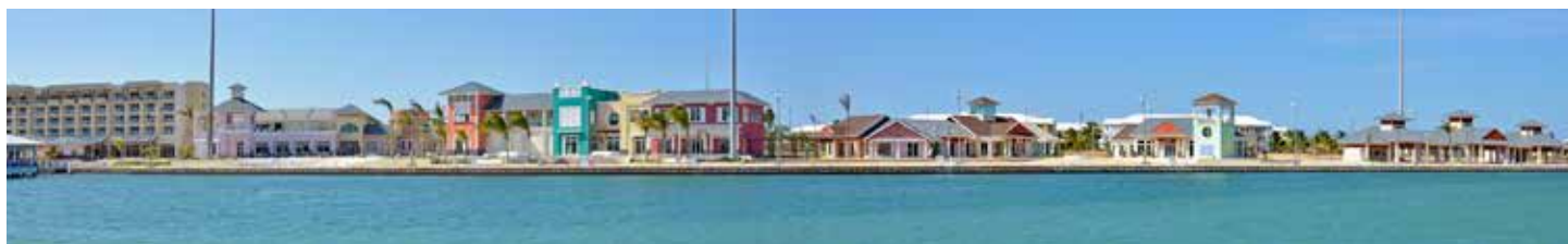
Pueblo Plaza Las Morlas

Местные виды транспорта: Такси, автобусы, аренда автомобилей, туристический автобус в ВарADERO. Ближайший международный аэропорт: ВарADERO (Хуан Гуальберто Гомес / Juan Gualberto Gómez) – 34 км (40 минут). Международный аэропорт Гаваны – 139 км (2 часа).