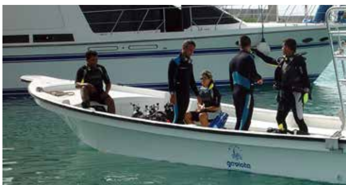
Центр дайвинга и рыбной ловли

Центр дайвинга и рыбной ловли находится в конце туристического поселка, недалеко от стоянки катамаранов, кондоминиумов «Восток» и здания Marina Gaviota. На территории расположен специализированный магазин. В центре предлагаются все виды услуг, связанные с профессиональным дайвингом и спортивной рыбалкой.