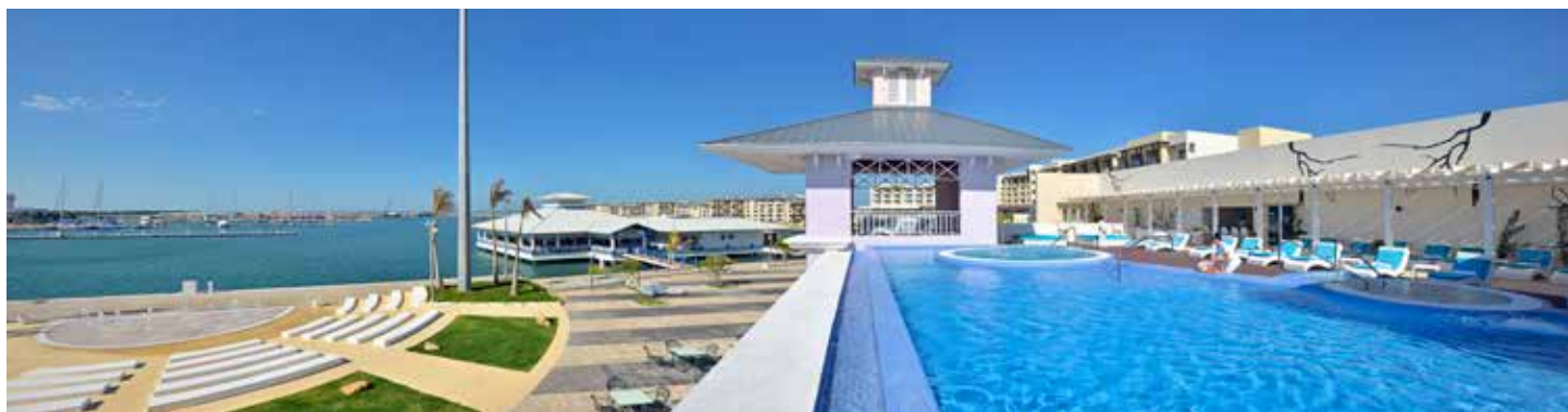
Yhi Spa Meliá Marina Varadero