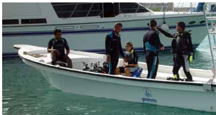
Centre de Plongée et de Pêche

Le centre de plongée et de pêche se trouve au bout du village, à proximité du terminal de catamarans, de la Zone d'Immeubles Est La Marina et du bâtiment de la Marina Gaviota. Il dispose d'un magasin spécialisé et propose tous les services et installations nécessaires à la pratique de la plongée professionnelle et de la pêche sportive.