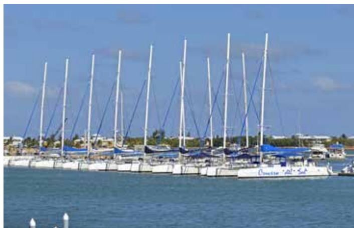
Terminal de Catamaranes

Le terminal de catamarans se trouve au bout du village, à proximité de la Zone d'Immeubles Est La Marina et du bâtiment de la Marina Gaviota. Il s'agit d'un vaste terminal avec accès direct qui fournit aux touristes un abri contre le soleil et la pluie avant ou après leurs excursions. Il dispose également d'une intéressante galerie d'artisans et d'un point de vente de restauration rapide.