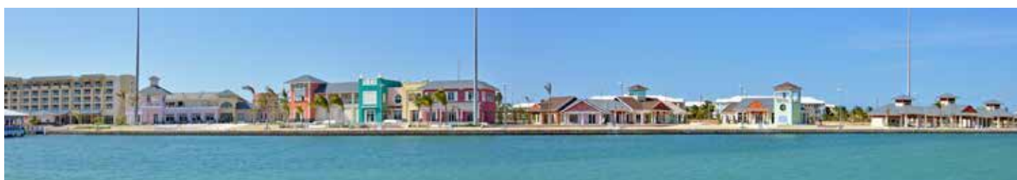
Pueblo Plaza Las Morlas

Transports locaux : Taxis, bus, location de voitures et Varadero Bus Tour. Aéroport international le plus proche: Varadero (Juan Gualberto Gómez) à 34 km (40 minutes). Aéroport international de La Havane à 139 km (2 heures).