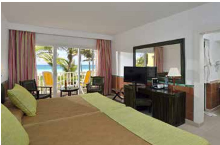
Superior-Zimmer mit Meerblick

Maximale Belegung pro Zimmer: Doppelbelegung und Doppelzimmer zur Einzelnutzung. In allen Zimmertypen: 2 Erwachsene + 2 Kinder (0-12 Jahre). Pro Zimmer ist nur 1 Zustellbett oder Kinderbett (auf Anfrage) möglich.