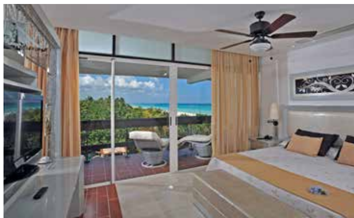
Номер повышенной комфортности с сервисом «Консьерж»

Максимальное размещение в номере: Размещение двухместное и двойное индивидуальное. Максимальное размещение в номере: 2 взрослых + 2 ребенка (кроме стандартных номеров повышенной комфортности). Семейный люкс: максимум 6 человек. полулюкс и люкс: 5 человек. Дети всегда должны быть в сопровождении взрослых. Устанавливается только одна дополнительная кровать или детская кроватка в номер (по запросу), кроме стандартных номеров повышенной комфортности.