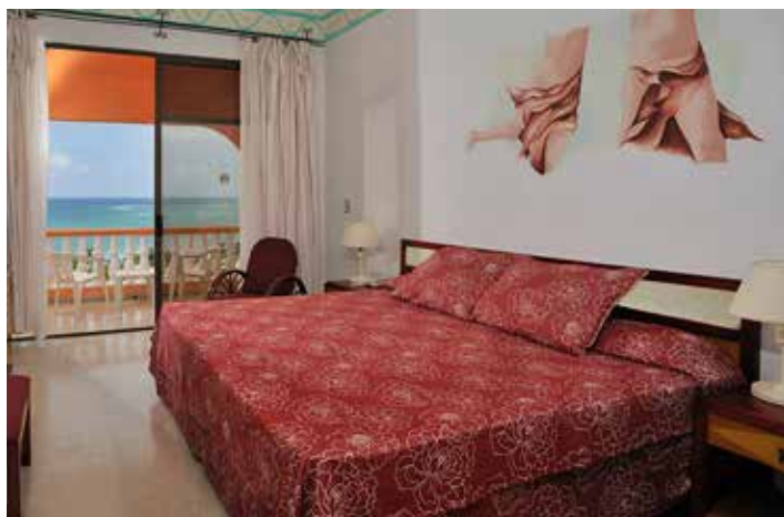
Habitación Superior Vista Mar

Máxima ocupación por habitación: Ocupación doble y doble uso individual. 2 adultos + 1 niño en estándar, 2 adultos + 2 niños en Junior Suite y Suites. 5 personas solo en habitación familiar vista mar. Niños siempre acompañados por adultos. Solo se acepta 1 cama extra por habitación.