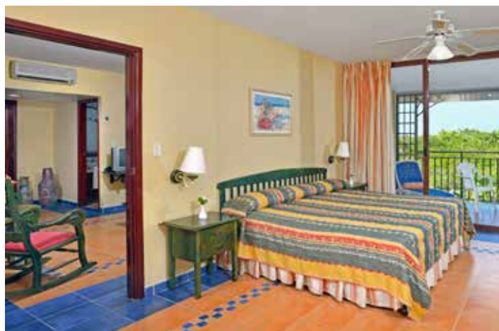
Suite Vista Mar