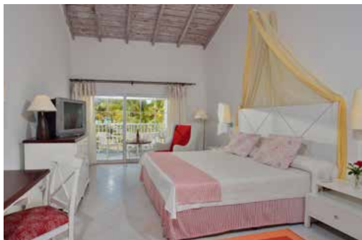
Habitación Superior Vista Mar