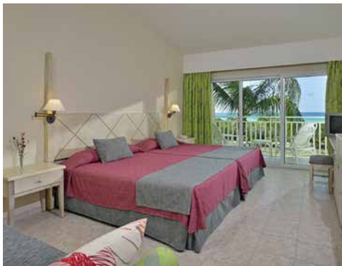
Стандартный номер с видом на море

Максимальное размещение в номере: Размещение двухместное и двойное индивидуальное. Для всех номеров: 2 взрослых + 2 ребенка (0-12 лет). Устанавливается только одна дополнительная кровать или детская кроватка в номер (по запросу).