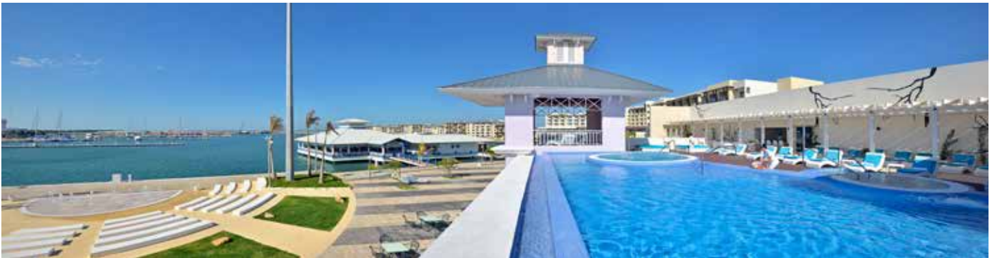
Yhi Spa Meliá Marina Varadero