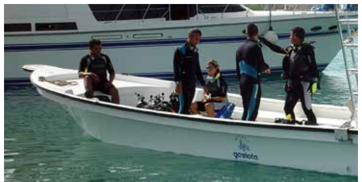
Tauch- und Angelcenter

Das Tauch- und Angelcenter befindet sich am Ende des Feriendorfes ganz in der Nähe des Katamaran-Anlegers, der Ferienwohnungen Condominio Este La Marina und des Gebäudes Edificio Marina Gaviota. Es verfügt über ein Fachgeschäft und bietet alle Dienstleistungen und Einrichtungen für den professionellen Tauchsport und Sportfischen.