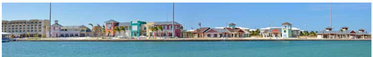
Pueblo Plaza Las Morlas

Es umfasst einen ganzen Komplex von Einrichtungen, die es zum vollständigsten und modernsten Angebot von Varadero machen. Bereich der Apartments, Hotel und Yachthafen. Für das Feriendorf wurde ein eklektischer karibischer Baustil mit verschiedenen Farben gewählt. Die einzelnen Lokale und Räumlichkeiten sind abwechselnd angeordnet, damit alle Bereiche zu jeder Tages- oder Nachtzeit belebt sind. Dank der Plätze können die Restaurants ihre Tische auf den Terrassen aufstellen und musikalische Darbietungen jeder Art organisieren. Der Anleger für Katamarane bietet den Touristen vor oder nach den Ausflügen Schutz gegen Sonne oder Regen. Wer das Meer liebt, findet vor dem Hafengebäude eine Promenade, ferner gibt es hier rund 1200 Liegeplätze und über 26 Anlegestege sowie weitere Dienstleistungen.