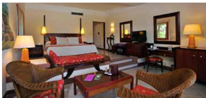
Paradisus Junior Suite

Habitaciones con vista al jardín. Área: 43 m 2 . Composición: sala-dormitorio, baño y balcón. Camas king o twin size con dosel. Ubicadas en bungalows de 2 plantas.