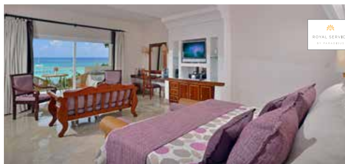
Luxury Junior Suite Servicio Real

Máxima ocupación por habitación: Ocupación doble o doble uso individual. Solo Adultos (a partir de 18 años). Ocupación máxima de habitación: 3 adultos. Solo se acepta 1 cama extra por habitación. Ocupación máxima en Servicio Real: 2 adultos.