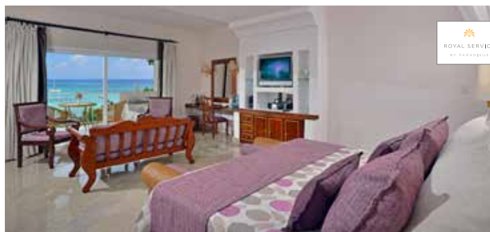
Luxury Junior Suite Servicio Real

Maximale Belegung pro Zimmer: Doppelbelegung oder Doppel für Einzelnutzung. Nur für Erwachsene (ab 18 Jahren). Maximale Zimmerbelegung: 3 Erwachsene. Pro Zimmer ist nur 1 Zustellbett möglich. Maximale Zimmerbelegung im Royal Service: 2 Erwachsene.