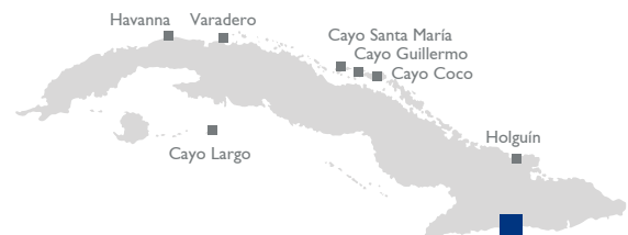
Meliá Santiago de Cuba

Es liegt im Wohnviertel Sueños, etwa 2 km von der historischen Altstadt und dem Tagungszentrum Teatro Heredia entfernt. Es liegt unweit von berühmten Plätzen und Sehenswürdigkeiten der Stadt, wie dem Tropicana Santiago, der Burg San Pedro de la Roca del Morro und anderen. Die Kapelle der Schutzheiligen von Kuba, der Madonna Caridad del Cobre, befindet sich in 17 km Entfernung.