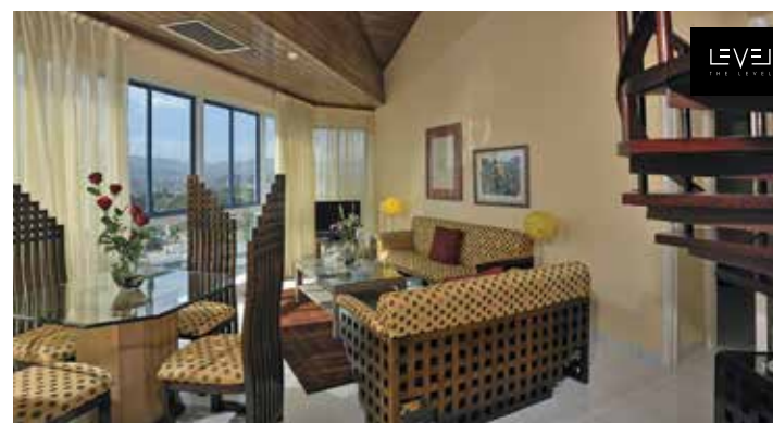
Präsidentensuite The Level