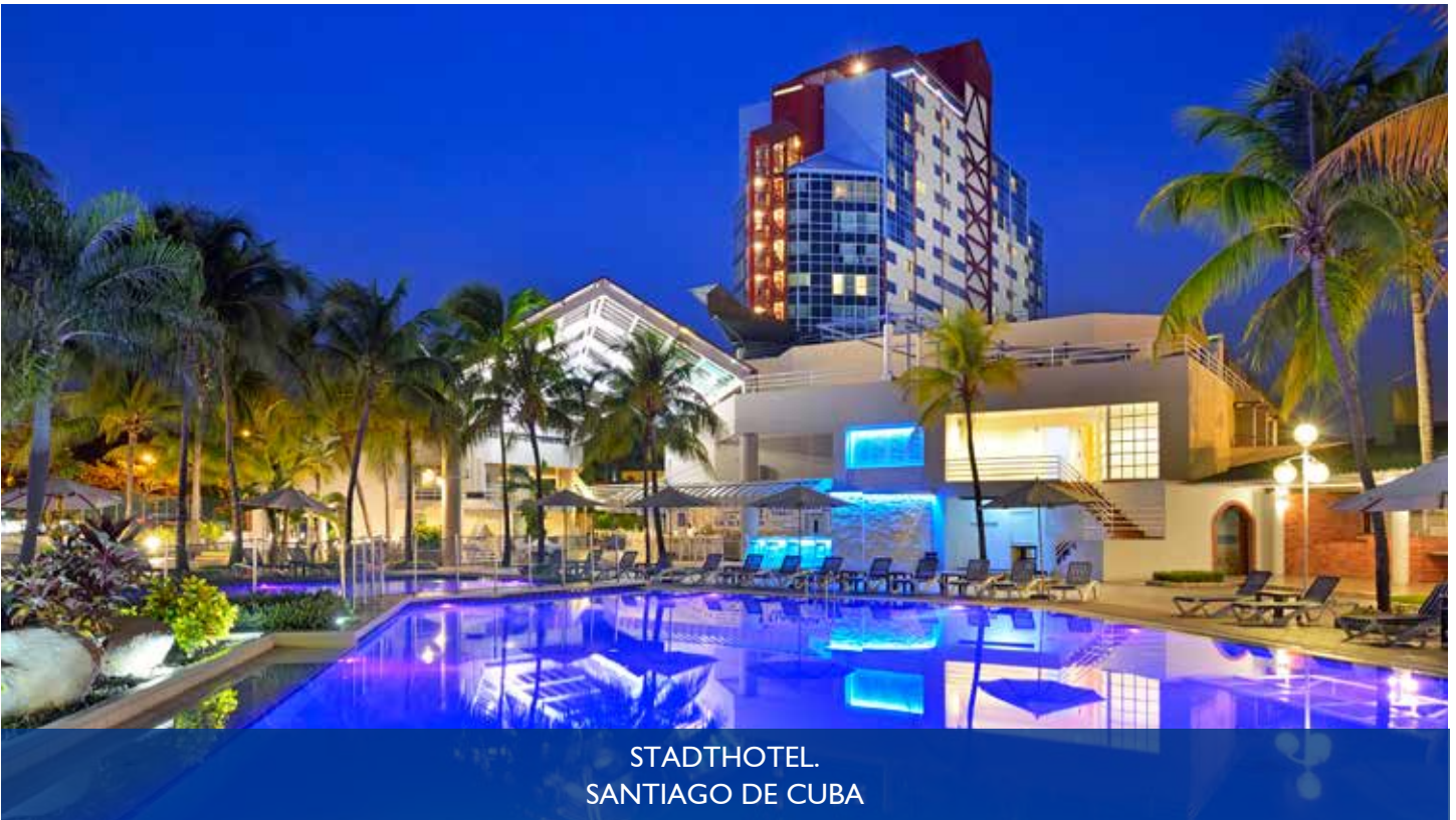
STADTHOTEL. SANTIAGO DE CUBA

Avenida de las Américas y Calle M, Reparto Sueño, Santiago de Cuba C.P: 90 400. Telf: (53 22) 68 7070 melia.santiago@meliacuba.com www.melia-santiagodecuba.com f MeliaSantiagoCuba