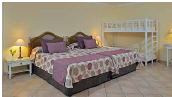
Family Junior Suite

Chambres avec vue sur le jardin. Surface : 42 m 2 . Description : placard/dressing, chambre/salon, salle de bains avec baignoire et douche. Terrasse ou balcon. Situées dans des bâtiments de 2 et 3 étages, aussi bien dans la zone des familles que dans celle des adultes, plus calme. Lits king-size et jumeaux.