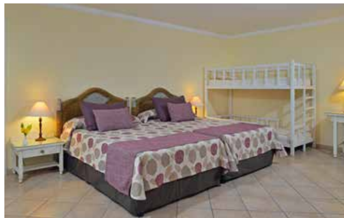
Junior Suite Familiar

Habitaciones con vistas al jardín. Área: 42 m 2 . Composición: clóset/vestidor, dormitorio/sala, baño con ducha y bañera. Terraza o balcón. Ubicadas en módulos de 2 y 3 plantas tanto en zona de familias como en zona tranquila de adultos. Camas king y twin size