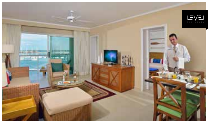
Grand Suite mit Blick auf Hafen The Level