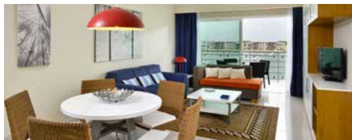
Two Bedroom Apartment