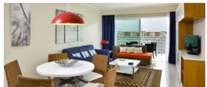
Apartamento Dos Dormitorios

Máxima ocupación por habitación: Ocupación doble y doble uso individual. APARTAMENTOS: Apartamentos Studio: 2 adultos + 1 niño o 3 adultos (no se acepta cama extra). Apartamentos Un Dormitorio: 2 adultos + hasta 3 niños o 3 adultos + 1 niño (niño compartiendo cama con adulto). Apartamentos Dos Dormitorios: 4 adultos + 2 niños o 5 adultos + 1 niño. Apartamento Tres Dormitorios: 6 adultos + 2 niños o 7 adultos + 1 niño (niño compartiendo cama con adulto) *Capacidad mínima en apartamentos: Apartamento de 1 dormitorio: mínimo 2 pax pagando como adultos. Apartamento de 2 dormitorios: Mínimo 4 pax pagando como adultos. Apartamento de 3 dormitorios: 6 pax pagando como adultos. Solo se acepta 1 cama o cuna extra (a solicitud) por apartamento (excepto en apartamento Studio). En todos los apartamentos hay un sofá-cama doble plaza (excepto en habitaciones con camas separadas).