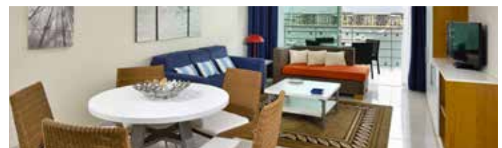
ZWEI SCHLAFZIMMER Apartment

Maximale Belegung pro Zimmer: Doppelbelegung und Doppel für Einzelnutzung. APARTMENTS: Studio-Apartments: 2 Erwachsene + 1 Kind oder 3 Erwachsene (Zustellbett nicht möglich). Ein-Schlafzimmer-Apartments: 2 Erwachsene + bis zu 3 Kinder oder 3 Erwachsene + 1 Kind (Kind teilt Bett mit Erwachsenen). Zwei-Schlafzimmer-Apartments: 4 Erwachsene + 2 Kinder oder 5 Erwachsene + 1 Kind. Drei-Schlafzimmer-Apartments: 6 Erwachsene + 2 Kinder oder 7 Erwachsene + 1 Kind (Kind teilt Bett mit Erwachsenen) *Mindestbelegung in Apartments: 1-Schlafzimmer-Apartment: mindestens 2 vollzählende Personen. 2-Schlafzimmer-Apartment: Mindestens 4 vollzählende Personen. 3-Schlafzimmer-Apartment: 6 vollzählende Personen. Es wird nur 1 Zustellbett oder Kinderbett (auf Anfrage) pro Apartment akzeptiert (außer im Studio-Apartment). In allen Apartments befindet sich eine Ausziehcouch für 2 Personen (außer in Zimmern mit getrennt stehenden Betten).