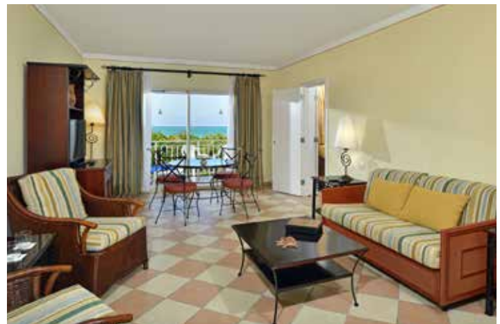
Royal Suite mit Meerblick