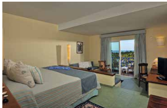
Junior Suite Sea View

Chambres avec vue sur la mer. Surface : 38,76 m 2 . Description : entrée, chambre/salon, fauteuils à bascule et canapé, salle de bains et terrasse. Services de l'Étage Concierge.*