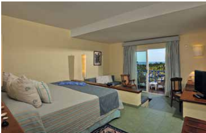
Junior Suite Vista Mar