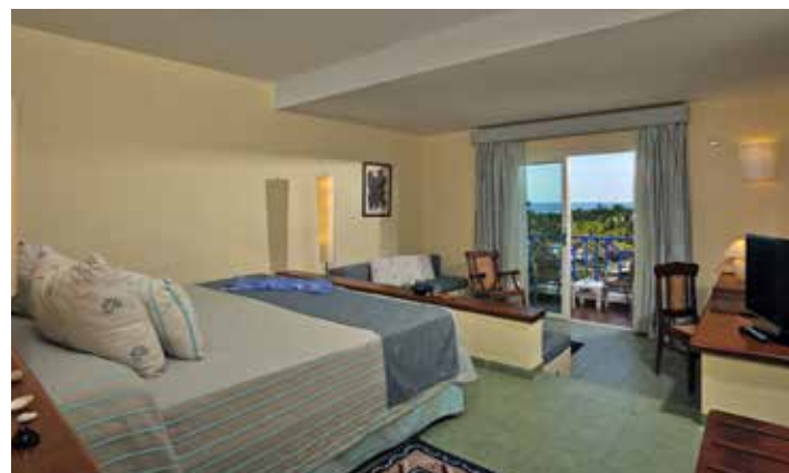
Junior-Suite mit Meerblick

Zimmer mit Meerblick. Größe: 38,76 m 2 . Aufteilung: Eingangsbereich, Schlaf-/Wohnzimmer, Schaukelstuhl und Sofa-Sitzbereich, Bad und Terrasse. Services der Concierge-Etage.*