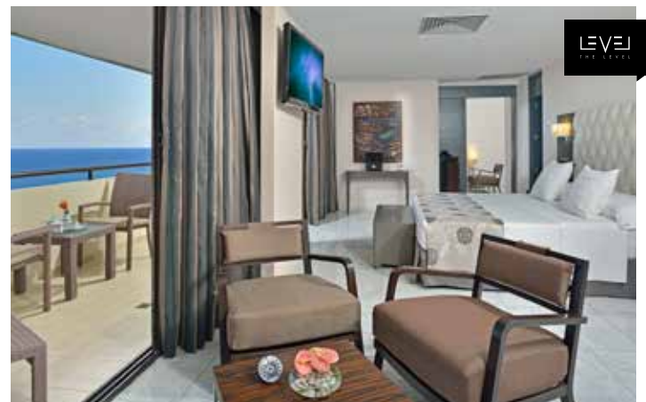
Grand Suite The Level