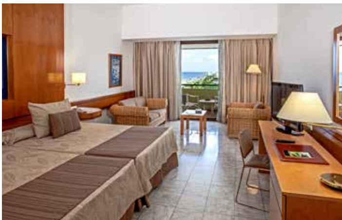
Klassik-Zimmer mit Meerblick

Maximale Belegung pro Zimmer: Doppelbelegung und Doppelzimmer zur Einzelnutzung. In allen Zimmertypen: 3 Erwachsene oder 2 Erwachsene + 2 Kinder (0-12 Jahre). Pro Zimmer ist nur ein Zustellbett oder Kinderbett möglich. Zustellbett auf Anfrage. Erwachsener oder Kind (2 - 12 Jahre). Baby (0 bis 2 Jahre). Kinder in Begleitung Erwachsener.