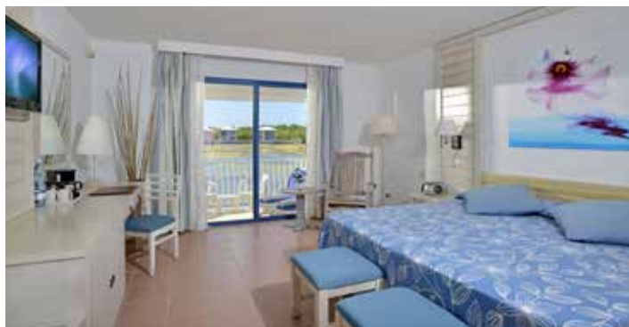
Grand Premium mit Blick auf die Lagune

Maximale Belegung pro Zimmer: Doppelbelegung und Doppelzimmer zur Einzelnutzung. In allen Zimmertypen: 3 Erwachsene. Pro Zimmer ist nur 1 Zustellbett (auf Anfrage) möglich.