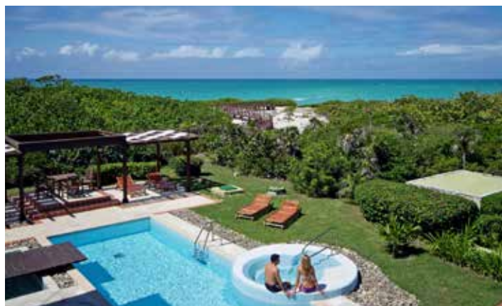
Villa Zaida del Río The Level