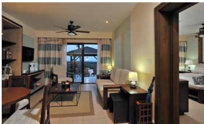
Royal Suite The Level

Maximale Belegung pro Zimmer: Doppelbelegung oder Doppel für Einzelnutzung. Nur für Erwachsene, ab 18 Jahren. In allen Zimmerkategorien: 2 Erwachsene oder 1 Erwachsener. Zustellbetten oder eine dritte Person sind nicht erlaubt. Maximale Belegung pro Zimmer: 2 Erwachsene.