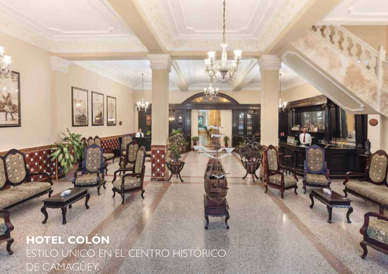
HOTEL COLÓN ESTILO ÚNICO EN EL CENTRO HISTÓRICO DE CAMAGÜEY.