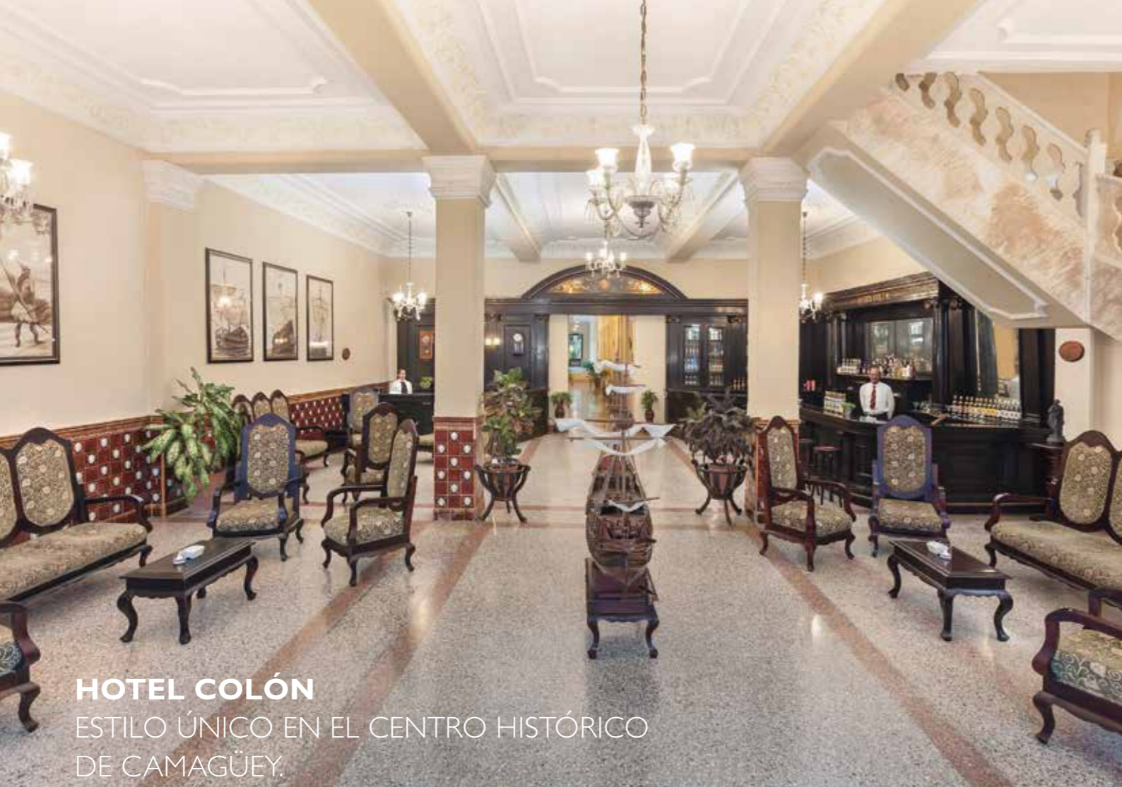
HOTEL COLÓN ESTILO ÚNICO EN EL CENTRO HISTÓRICO DE CAMAGÜEY.